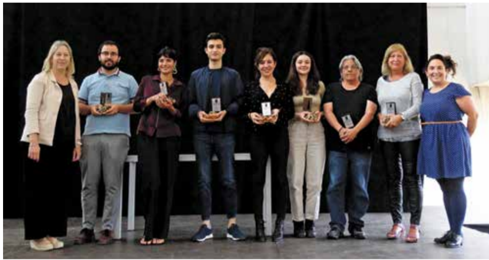
► Els guanyadors de la XXVIII edició dels Premis Francesc Candel recullen l'estatueta.

El certamen es consolida amb 169 participants i destacant les històries quotidianes