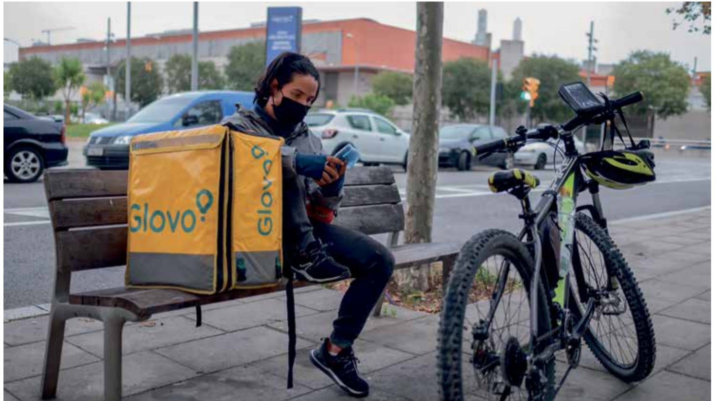
Un rider en espera de la comanda enfront del centre comercial Gran Via 2 (foto d'arxiu).