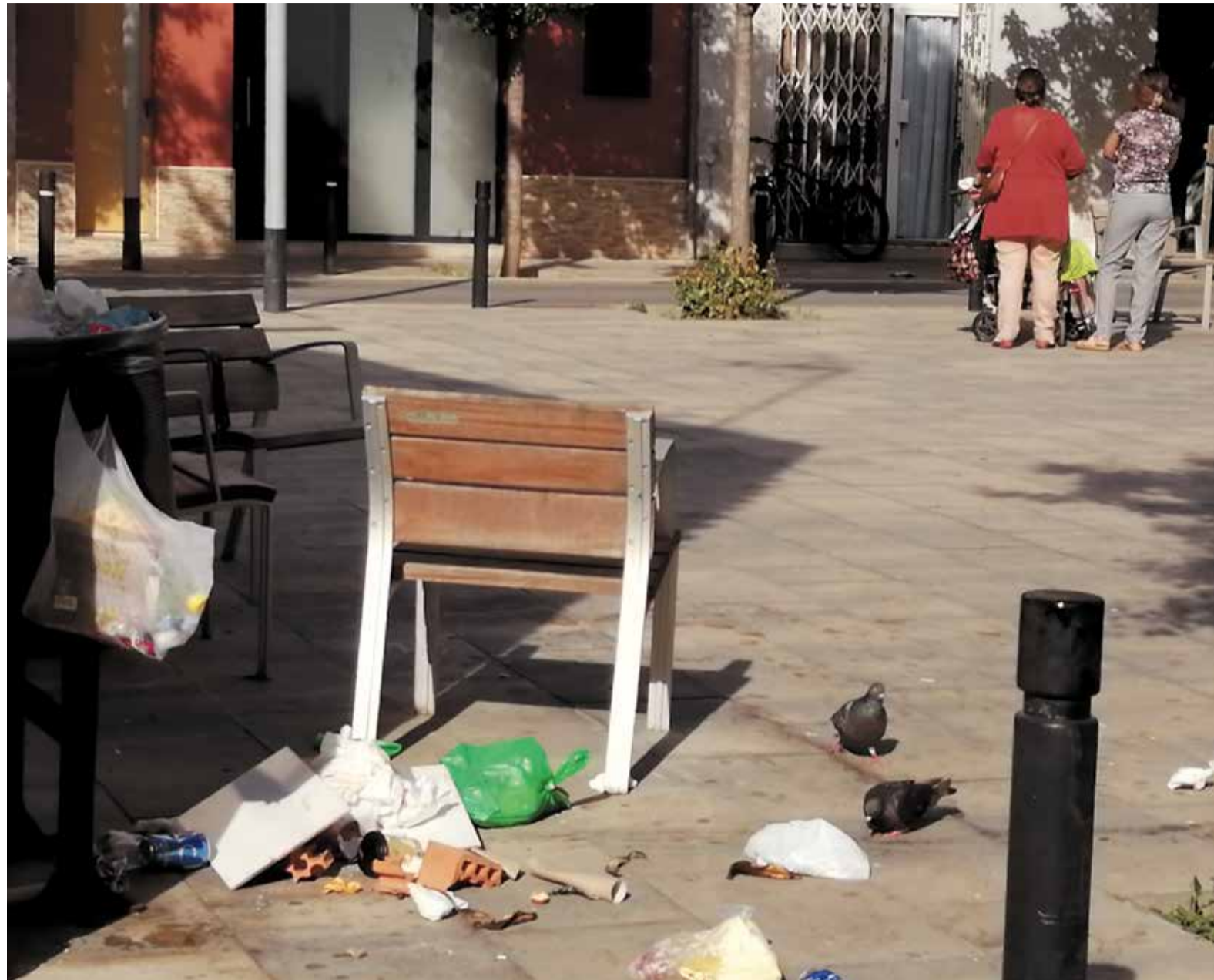
Deixalles i trencadisses a la placeta de la barriada del Plus Ultra, entre els carrers Aviador Ruiz de Alda i Pablo Rada.