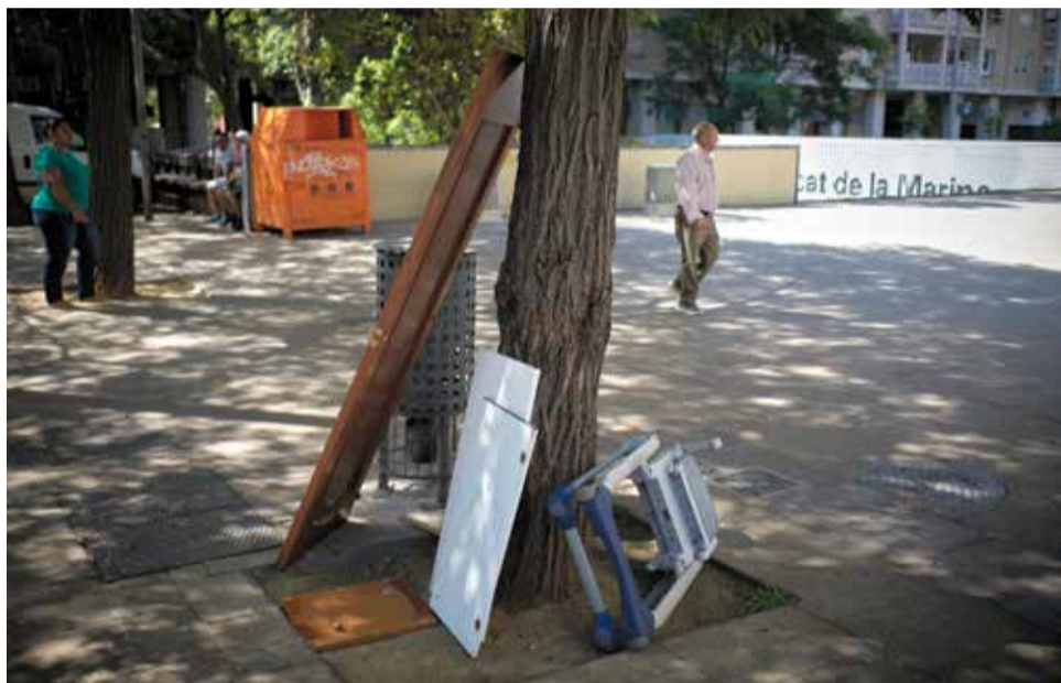
A dalt, vidre trencat de l'ascensor que connecta el Polvorí amb Mare de Déu de Port. A baix, mobles antics deixats enmig del carrer a la plaça Marina.