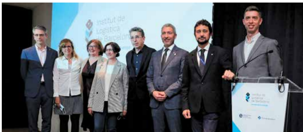
Representants del Port de Barcelona, de la Generalitat de Catalunya, de l'Ajuntament i del Consorci d'Educació de Barcelona.

L'aposta per centres singulars per àmbits professionals permet la concentració del talent de docents i alumnes i es converteix en una eina que clarifica l'oferta, i facilita l'orientació per a l'alumnat del seu horitzó formatiu i professional.