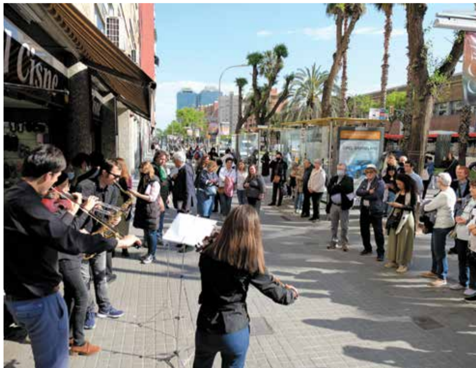
► El grup de músics del COAC, seguit pels organitzadors i assistents, al seu pas per alguns dels comerços del barri. Alejandro Flores