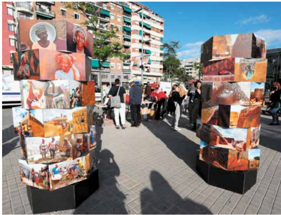
► Una exposició al carrer va ser el reclam perquè molts s'hi apropin.

barris. "A la Marina volem donar impuls a una reivindicació estratègica: aconseguir que el passeig de la Zona Franca sigui realment un passeig, i que es converteixi en un atractiu per a gent de dins i fora del barri, que vingui a comprar al comerç de proximitat i a descobrir un barri com la Marina", comentava.