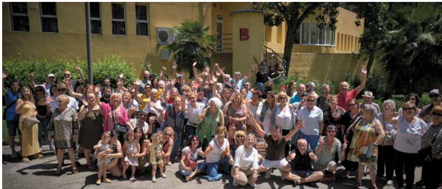
► Veïns, veïnes, la directiva de la Unió d'Entitats, l'equip de treballadors del centre i conselleres del districte al brindis pel 35è aniversari.

L'equipament celebra l'aniversari amb una programació especial