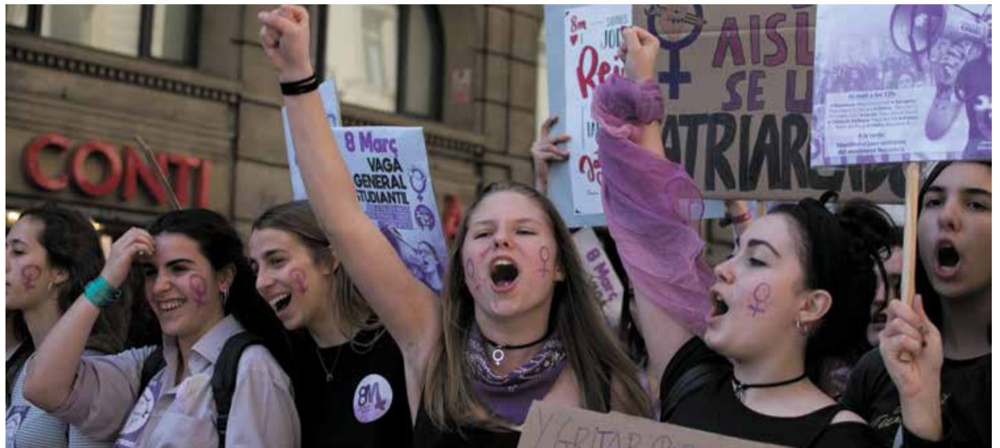
► Manifestació del 8M a Barcelona, l'any 2019.

- Les dones de 16 i 17 anys podran interrompre voluntàriament l'embaràs sense haver de necessitar el permís dels pares o tutors; això ja era així abans de la modificació de la llei que va fer el Partit Popular retallant la llei del govern de Rodríguez Zapatero l'any 2010. També, ja no són necessaris els 3 dies de reflexió, obligatoris abans de fer una interrupció voluntària de l'embaràs. Però en aquest dies podran llegir tota la informació que se'ls entrega en un sobre, si ho sol·liciten, amb tota la informació sobre les ajudes a què es té dret si se segueix endavant amb l'embaràs i amb les línies de suport que rebria la criatura si no s'avorta i aquesta neix amb alguna malformació.