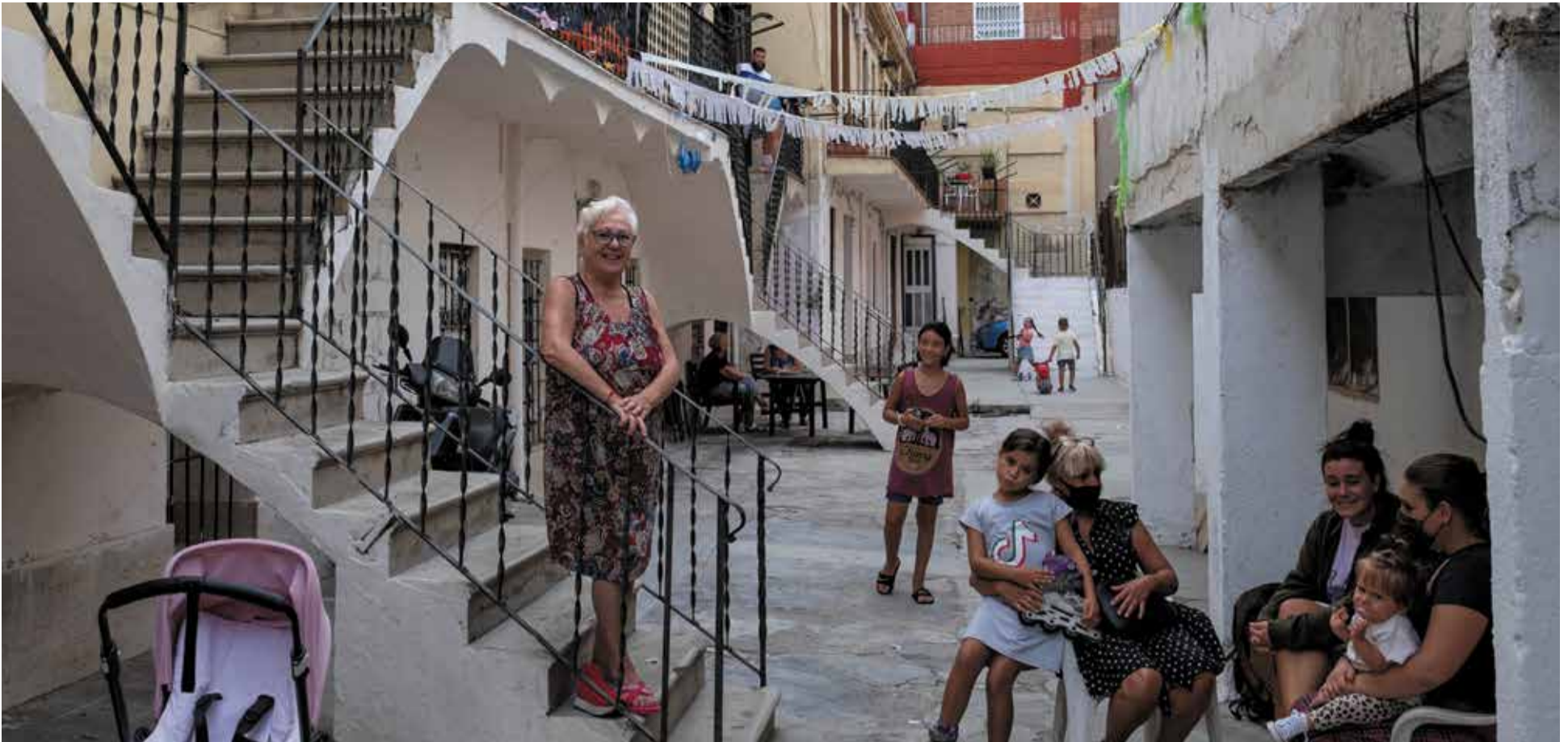
Veïnes de Can Bausili fan petar la xerrada al carrer, en l'ambient familiar que caracteritza les relacions entre el veïnat dels nuclis de la colònia Bausili i Eduard Aunós.